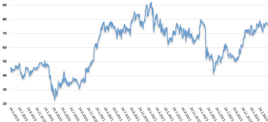
Vývoj ukazovateľa P/E v 3 ročnom horizonte