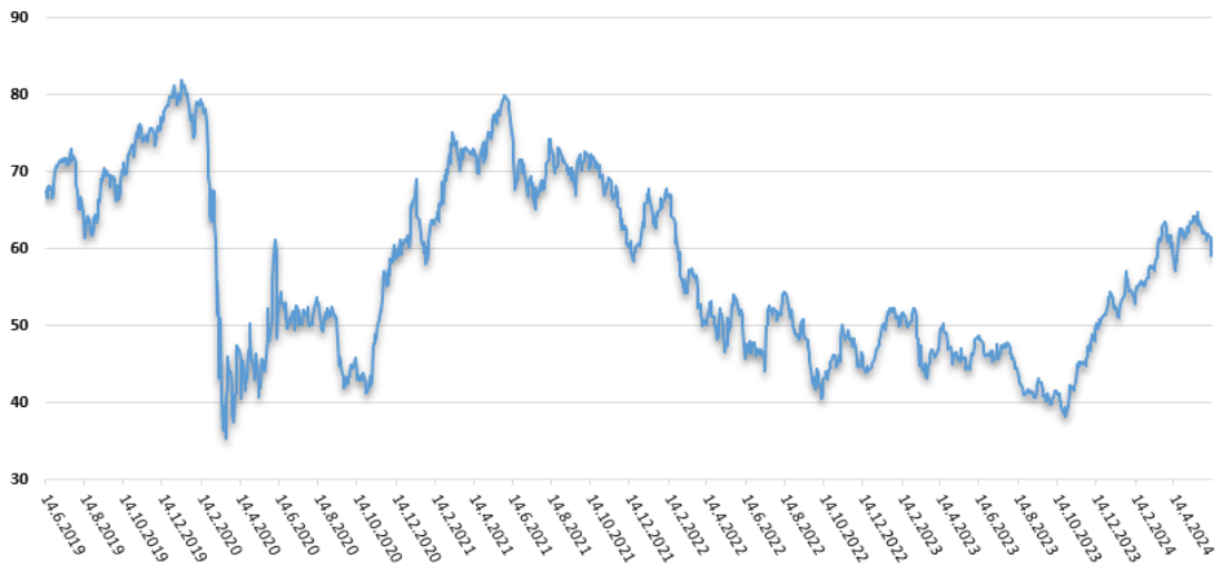
Vývoj ukazovateľa P/E v 3 ročnom horizonte