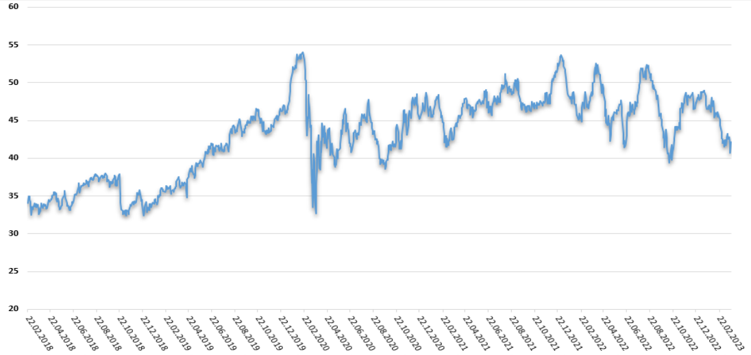
Vývoj ukazovateľa P/E v 3 ročnom horizonte